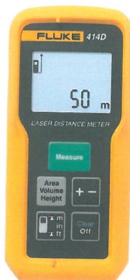
Рисунок 1. Общий вид дальномера лазерного Fluke 414D