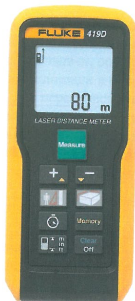
Рисунок 2. Общий вид дальномера лазерного Fluke 419D